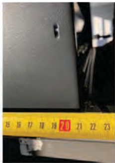
Глубина – 21,5 см (включая отверстие для кабеля).