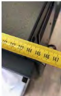
Ширина – 146 см (включая крепежные выступы).