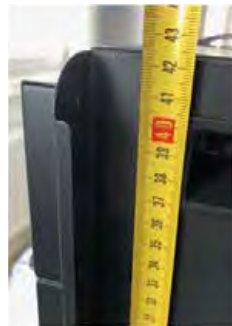
Высота – 42,5 см